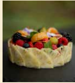
Tomate Cerise Salade de fruits revisitée 07 81 95 01 30