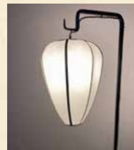
La Maison de l'Abat-jour et du Fauteuil Abat-jour « Dôme oeuf » 06 59 96 97 15