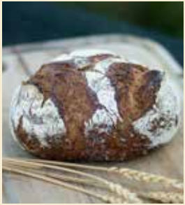
Saveurs d'Antan Pain d'Antan