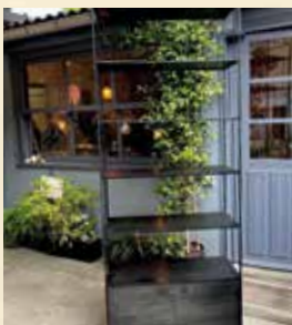
Bout de Fer & Compagnie Meubles métal sur mesure 07 89 22 56 13