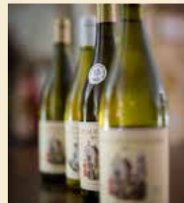
Confrérie des Coteaux de Sucy Vin de Sucy 06 07 99 24 58