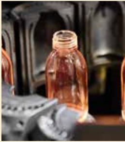
SGD Pharma Emballages pharmaceutiques en verre 01 45 10 70 07