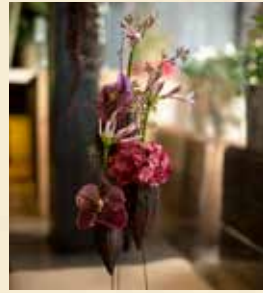
Paradoxe Bouquets et réalisations florales 01 45 76 25 01