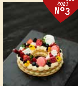
Cake & Style Pâtisseries sur mesure 06 48 00 82 24