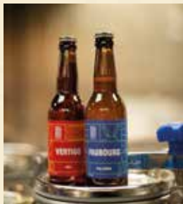
Babap Bières artisanales 01 77 17 52 97