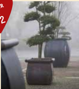
Ville de Sucy Bac à végétaux monumentaux 01 49 82 24 50