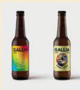
Brasserie Gallia Bières East IPA et Weiss & Versa 01 57 14 56 72