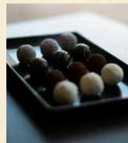
La Cabosse Gourmande Les bulles de Sucy 01 71 34 11 93