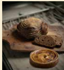
Boulangerie Gaule Pain de vignes et Flan au miel 01 45 90 22 19