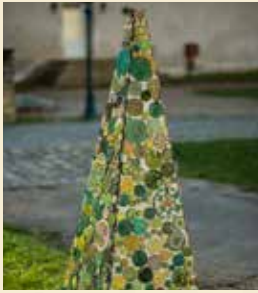
Les Terriennes Œuvre collective en céramique 06 85 23 02 62