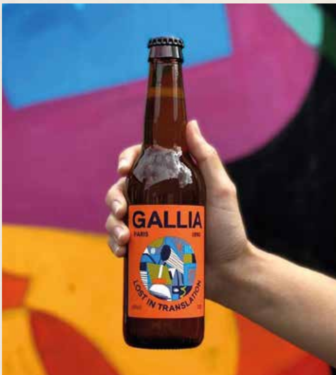
East IPA et Weiss & Versa

Des bières privilégiant les matières premières locales de qualité et brassées à Sucy