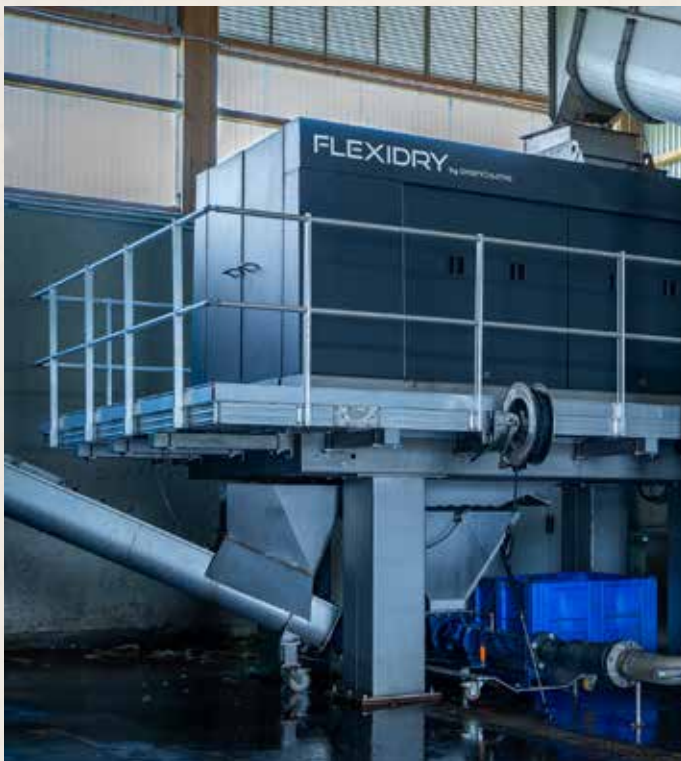
Gamme de produits Flexidry

Une technologie de pointe pour valoriser et recycler les biodéchets