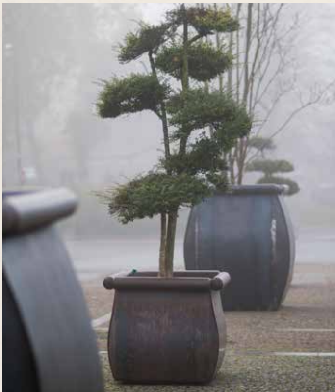
Bacs à végétaux monumentaux

Imagination et savoir-faire en ferronnerie d'art des agents municipaux