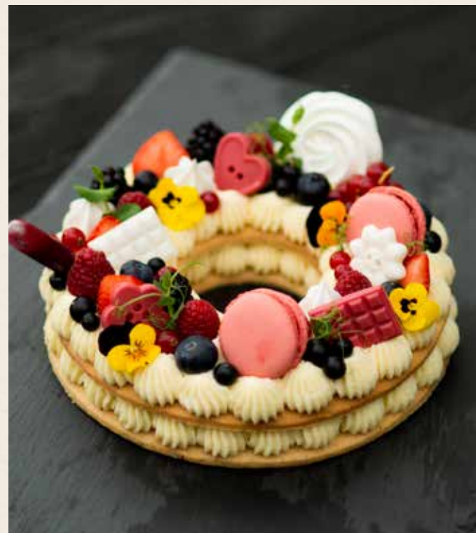
Pâtisseries et gâteaux sur mesure

Gourmandises confectionnées au gré de vos envies