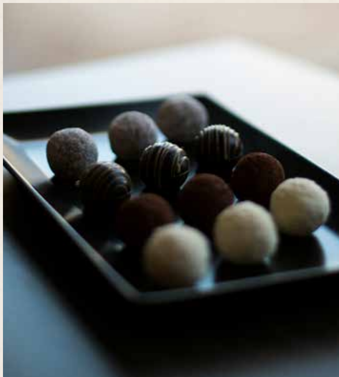
Les Bulles de Sucy

Un bonbon de chocolat, garni de ganache, clin d'œil au grain de raisin sucyen