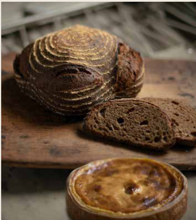
Pain de vignes et Flan au miel

Douceurs à base de moût de raisin des vignes de Sucy et du miel de Sucy