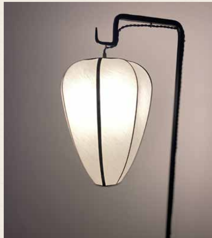
Abat-jour « Dôme Œuf »

Création et fabrication d'abat-jour et réfection de fauteuils