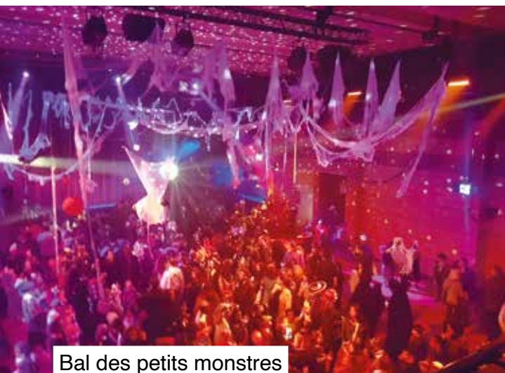
Bal des petits monstres