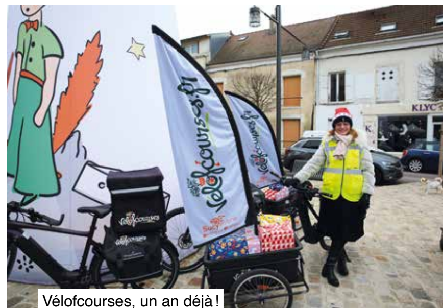
Vélofcourses, un an déjà !

Concernant le calendrier, maintenant que l'épidémie ne devrait plus perturber notre quotidien, une réunion spécifique se déroulera pour chaque conseil entre février et mars 2023 pour l'ébauche des projets. Fin mai/début juin, les conseils devront pouvoir présenter des propositions abouties. Chaque conseil a aussi la possibilité d'organiser un vote dans son quartier pour solliciter l'avis des habitants.