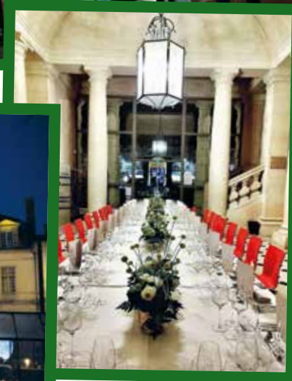
▲ Table dressée au Château pour les gagnants de la tombola